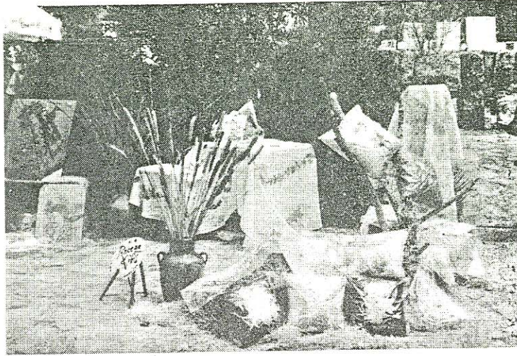
معروضات في الحديقة.